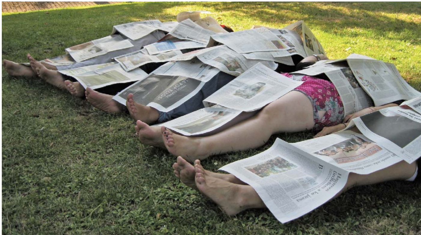
Al empezar a insultar a un compañero, los cinco estudiantes fallecieron a causa del virus. Caracas, Venezuela.

“Venimos alterando el ecosistema sin visión global alguna. Sus consecuencias lo denuncian. Cada vez son más frecuentes e intensos los huracanes, los terremotos, las inundaciones, las sequías. Si continuamos impasibles, la naturaleza pronto arrasará la civilización en segundos y, dentro del caos posterior, se producirá una selección despiadada y brutal de mano del